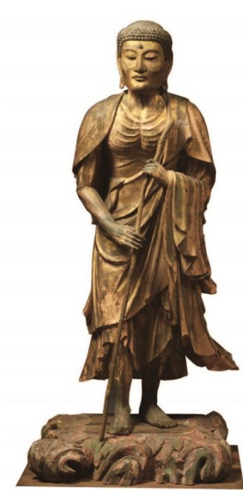
⑨ 出山釈迦立像／南北朝時代（14世紀） 奈良国立博物館蔵