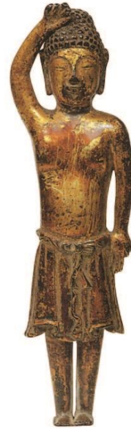
⑥ 誕生釈迦仏立像／統一新羅（8～9世紀） 広島・康徳寺藏