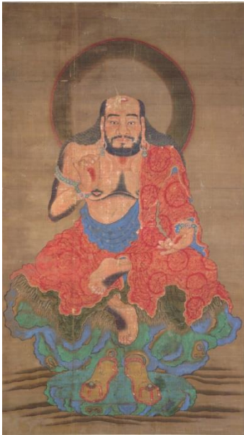
⑦ 釈迦三尊像（部分）伝顔輝筆／中国・元時代（14世紀） 京都・鹿王院藏 <4/21～5/20>