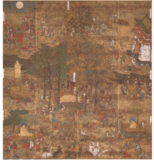
⑩ 重要文化財 涅槃変相図／鎌倉～南北朝時代（13～14世紀） 岡山・遍明院蔵 <5/22～6/17>